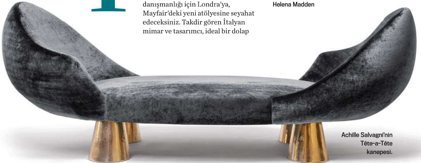
Achille Salvagni'nin Tête-a-Tête kanepesi.

yapımı için en iyi madenden orijinal taşa, ideal cila sanatçısına kadar her detayı gözden geçirecek. Ayrıca galerisinde sergilenmeden önce bir sonraki koleksiyonuna göz atma fırsatınız da olacak ve monografisinin imzalı bir kopyasına sahip olacaksınız. Mobilyanın yapımı yaklaşık dört ayda tamamlanacak -ne de olsa bu seviyede bir sanatkarlık aceleye getirilemez- ama siz de Zoom üzerinden bu yaratım sürecinin her adımına dâhil olacaksınız. 35.000 Dolar'dan başlayan fiyatlarla; london@achillesalvagni.com Helena Madden